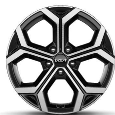
Jante din aliaj de 18"

*Imaginile afișate au caracter ilustrativ. Culoarele pot varia în funcție de culorile monitorului și pot apărea diferite în comparație cu produsul real.