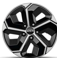
Jante din aliaj de 16"